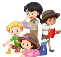
SUPORTA AS DIFERENÇAS