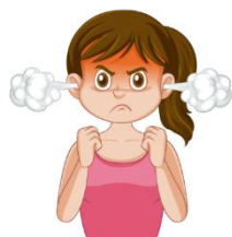
NÃO SE IRA FACILMENTE