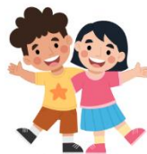
SE ALEGRA COM A VERDADE