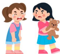
NÃO É EGOÍSTA