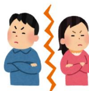
NÃO GUARDA MÁGOA