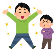
NÃO É INVEJOSO