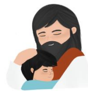
CRÊ EM DEUS